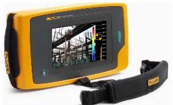
在可见光中准确定位局部放电位置