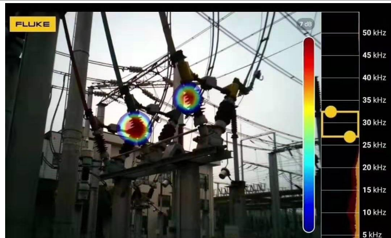
使用声学成像仪对高压电气设备的绝缘子进行局部放电排查

局部放电是高压电气设备经常会遇到的问题，会造成电气设备损坏甚至危及人员安全，而现有检测手段非常耗时且有漏检可能；最新的声学成像技术将局部放电的单点检测变为图像排查，快速、准确。本文通过Fluke最新的 ii900 声学成像仪检测高压电气设备接头局部放电的案例和技术要点，帮助电气维护人员对局部放电进行及时排查和处理，保证电气设备的正常运行。